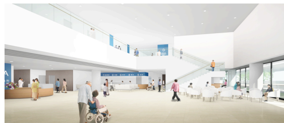
*エントランス CG イメージ